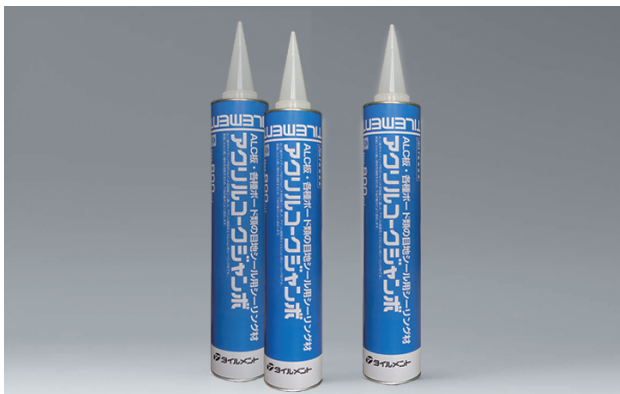
アクリル系シーリング材

ALC板や窯業系サイディング材のジョイント目地施工に適した、アクリル系のシーリング材です。長期にわたり高い弾性を持続するため、下地の動きによく追従します。