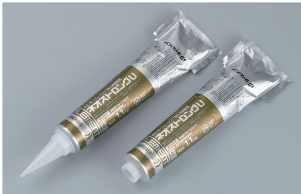
ウレタン樹脂系接着剤

ネオストロングUは根太・束・フローリング施工などに適した一液湿気硬化形ポリウレタン樹脂系接着剤です。臭いが少なく初期硬化性に優れています。手絞りでもカートリッジ仕様でも使えるダブルパックです。