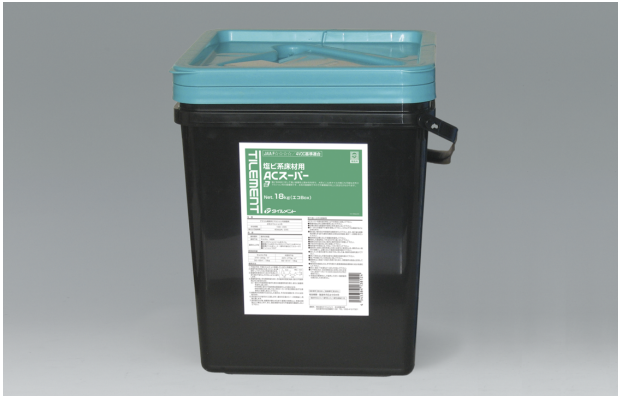
アクリル樹脂系エマルジョン形接着剤

ビニル系床材に対して高い接着性を持つアクリル樹脂系エマルジョン形接着剤です。 耐水工法用として開放廊下にも施工可能な水系の接着剤ですので低臭かつ安全です。